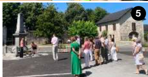
1- Repas sous les Halles animé par la Banda 2- Une heureuse gagnante du loto 🍀 3- Ambiance conviviale lors du loto du vendredi soir 4- Les vainqueurs du tournoi de pétanque. 5- Dépôt de gerbe au monument aux morts