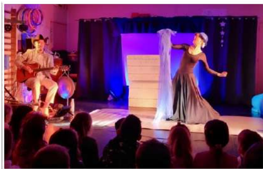
Conte musical Surya et la fée des Couleurs

Ces moments privilégiés n'auraient pas été possibles sans la mobilisation collective de l'APE et la participation de toutes celles et ceux qui, par leurs achats ou leur aide, ont soutenu ces projets.