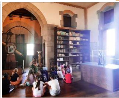
Château-observatoire d'Abbadia à Henday