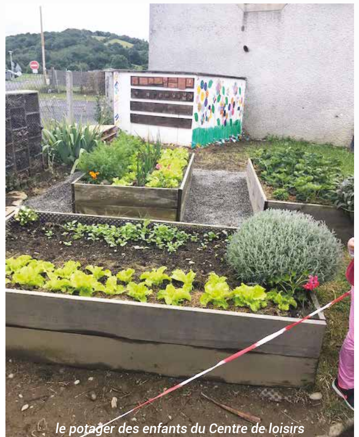
le potager des enfants du Centre de loisirs