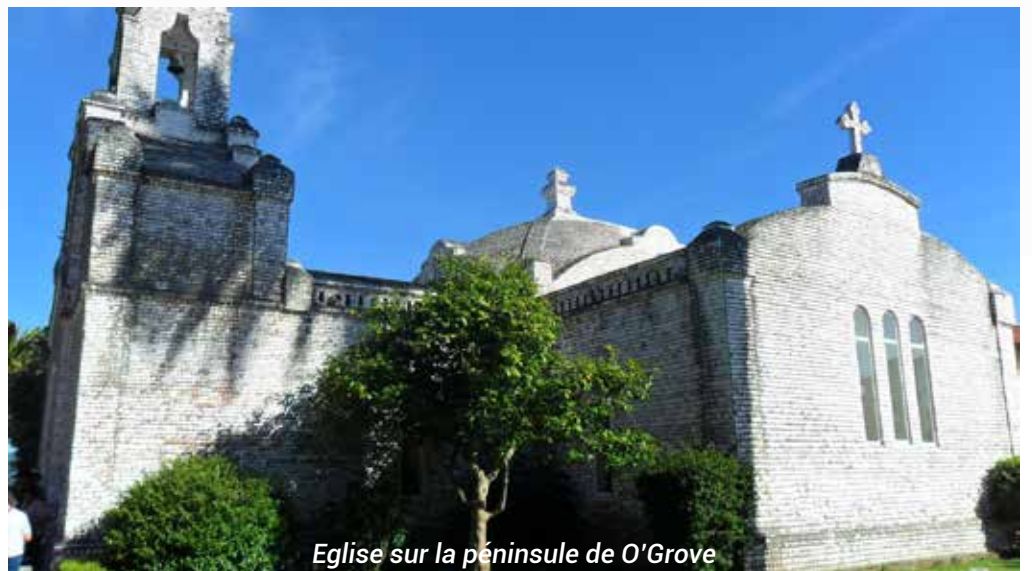
Eglise sur la péninsule de O'Grove

A Combarro, village de pêcheurs, ce sont les « horreos » qui ont été admirés. Ces greniers à grains, conçus pour faire mûrir et sécher le maïs, à l'abri des